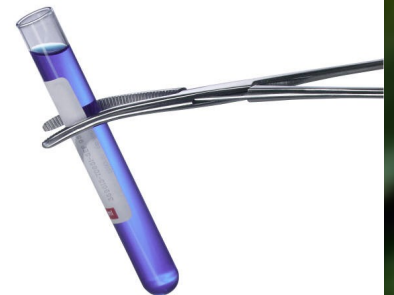
Caption describing picture or graphic.

If space is available, this is a good place to insert a clip art image or some other graphic.